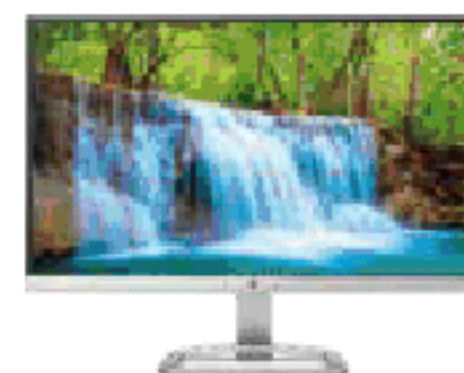
HP 22es (Ref.: T3M70AA)