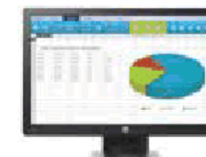
HP ProDisplay P203 (Ref.: X7R53AA)