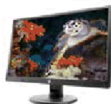
HP V214a (Ref.: 1FR84AA)