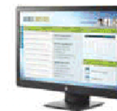
HP ProDisplay P223 (Ref.: X7R61AA)