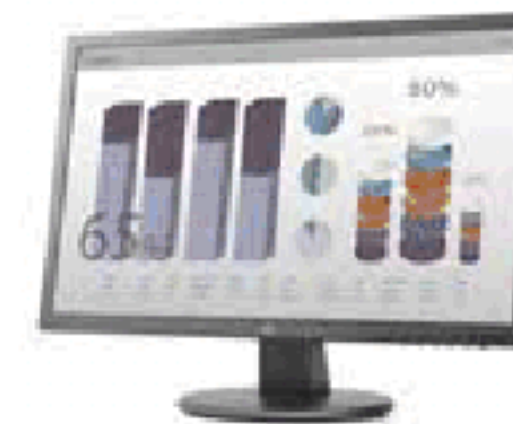
HP V243 (Ref.: W3R46AA)